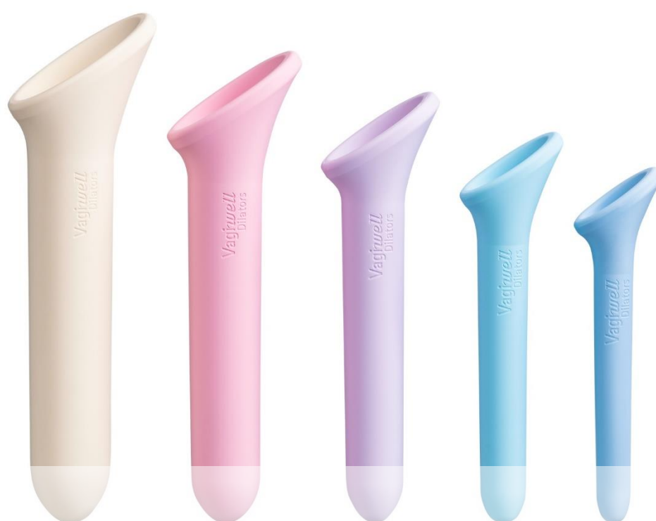
Dilatorsett i silikon